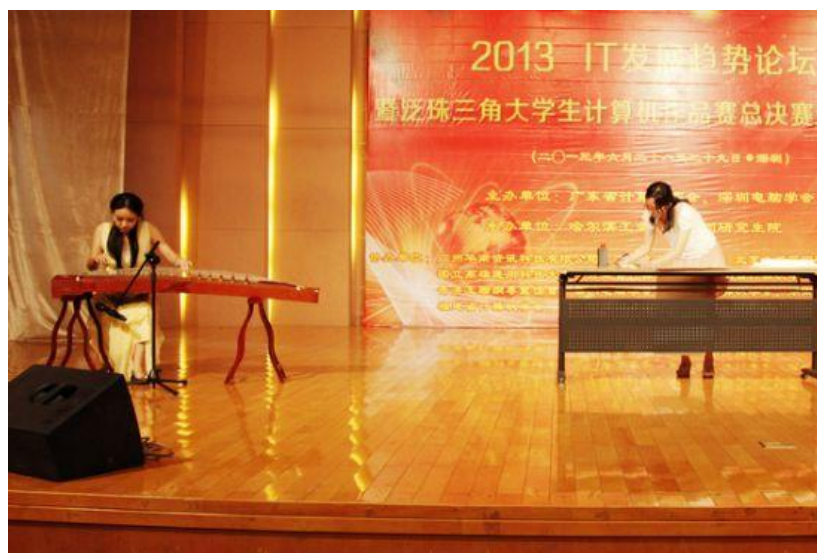
哈工大深研院节目演出